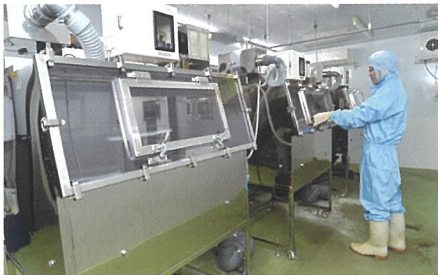
■アインレーター(鶏各種試験)

社内飼育施設での非臨床試験、および畜産現場と連携した臨床試験の実施が可能で、 検査・分析体制も十分に整備されています。