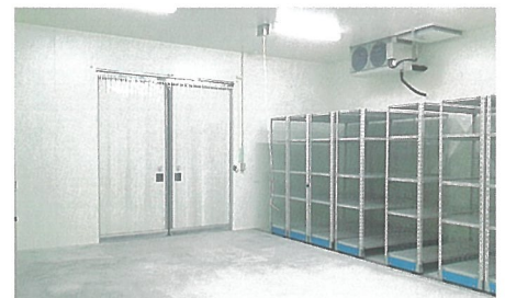
■動物用医薬品の保管施設(GMP)