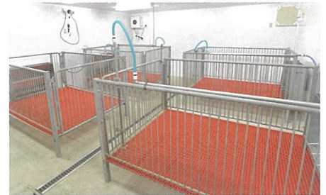
■動物飼育室(社内飼育室)の一例